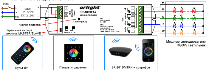
Рис.1. Схема подключения и варианты управления контроллером.