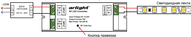
Рис.1. Схема подключения диммера.