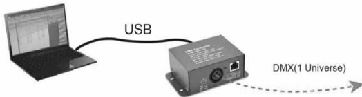
Рис.1. Подключение контроллера в режиме управления от ПК.

ВНИМАНИЕ! Во избежание поражения электрическим током перед началом работ отключите электропитание. Все работы должны проводиться только квалифицированным специалистом.