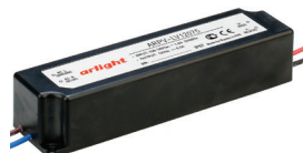
ARPV-LV12060 ARPV-LV12075 ARPV-LV24060 ARPV-LV24075