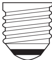
E27 IEC 7004-21