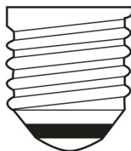
E27 IEC 7004-21