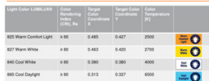
Light colors, color rendering properties and Light Color Coordinates for OSRAM DULUX® - lamps with integrated control gear

1 | Datenname | ORG CODE | Initial Titel/Versionierung | T17M01J22