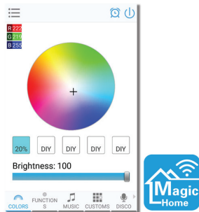
Рис.4. Логотип и основной экран приложения.

ВНИМАНИЕ! При первом подключении рекомендуем подключиться к сети RGBW контроллера LEDnetXXX, проверить работу оборудования, а затем, при необходимости, подключиться к домашней сети.