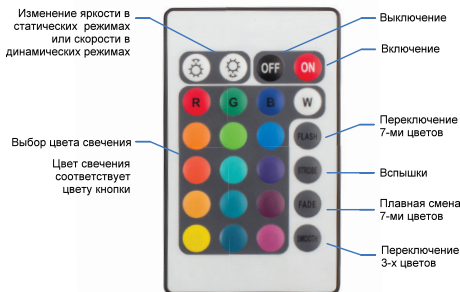
Рис.3. Управление контроллером.